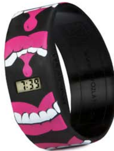
MOUTH TO MOUTH