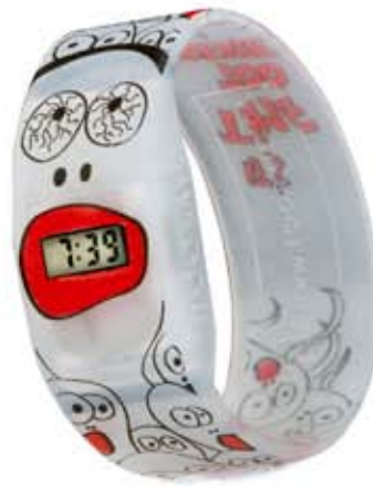
IT'S TIME TOO CREATE (SADNESS)