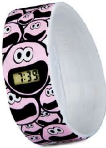
IT'S TIME TOO CREATE (HAPPINESS)